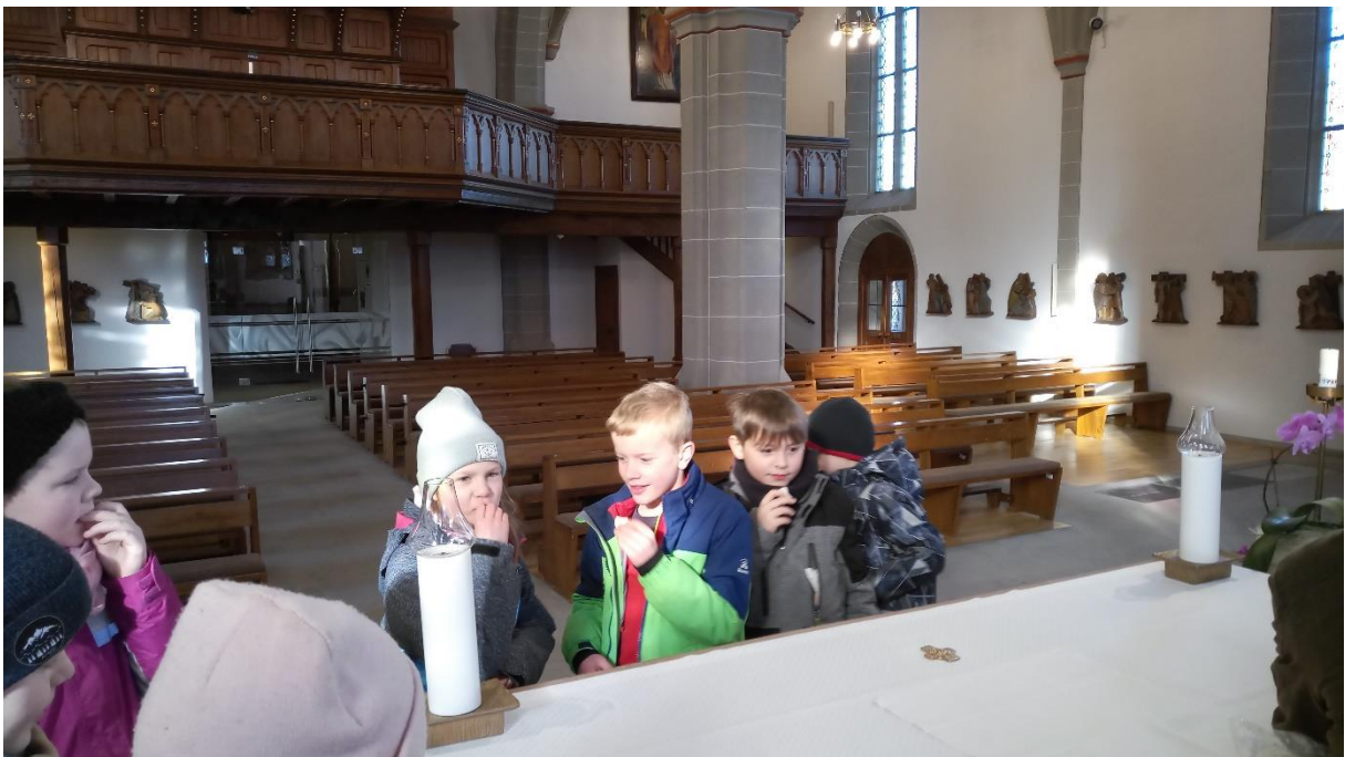
Probieren der Oblaten in der katholischen Kirche