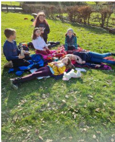
Spielpause in der Sonne!

Auch die Klasse 4b war unterwegs in Elbenberg. Am und ums Türmchen gab es viel zu entdecken. Im anliegenden Wäldchen bauten die Kinder Baumhäuser und sammelten Material, aus dem sie später gebastelt haben. (Fr. Werner)