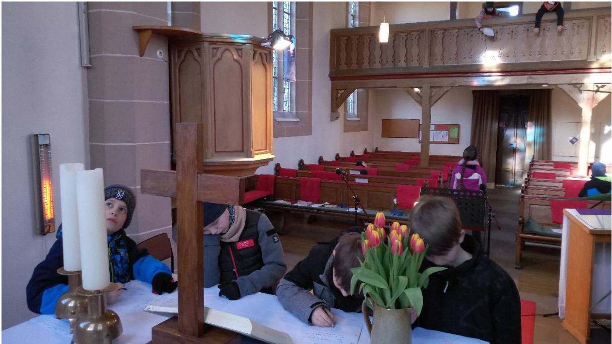
Beobachtungsaufträge in der evangelischen Kirche und