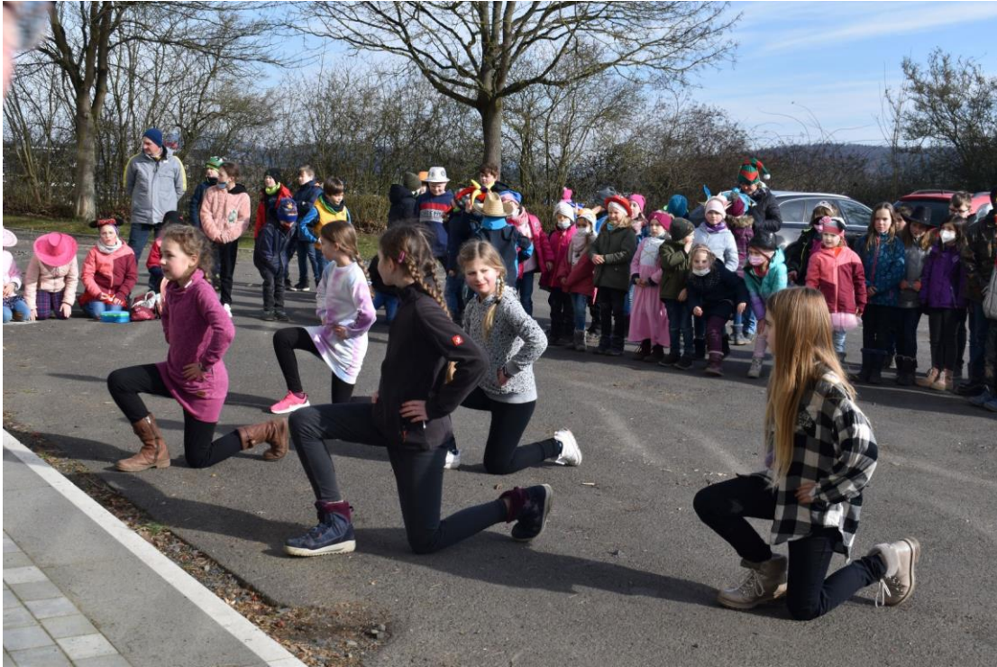
Tanzvorführung einiger Mädchen aus der Klasse 4b

Elternbeirat und Förderverein kümmerten sich um die Ausgabe der Berliner, die von der Firma Kröninger gespendet wurden. Allen Helfern und dem großzügigen Spender ein ganz herzliches Dankeschön!