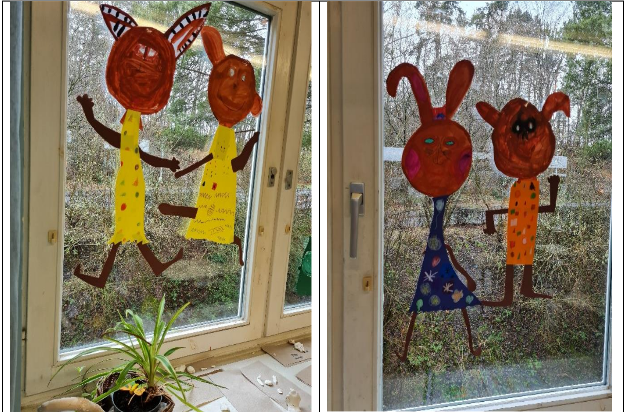
Die lustigen Hasenmädchen aus der 2b wünschen schöne Ferien!