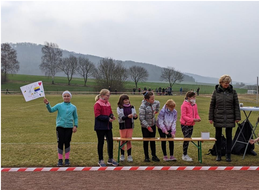
Die Klasse 4a anfeuernd am Rand....