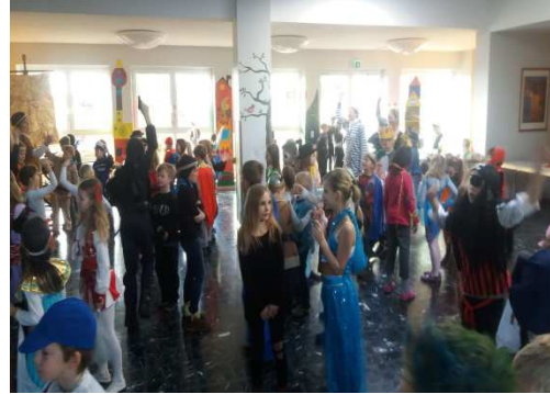
Buntes Treiben in der Aula