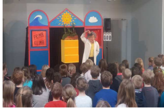
Klimaveränderungen anschaulich erklärt

Tags zuvor stellte der Glasbläser den Kindern sein altes Handwerk vor. Es war faszinierend zu sehen, wie aus einem Rohling zum Beispiel eine Glaskugel entstand. Heiß begehrt war auch der Verkaufswagen, an dem die Kinder in den Pausen kleine Tiere aus Glas für wenig Taschengeld erstehen konnten.