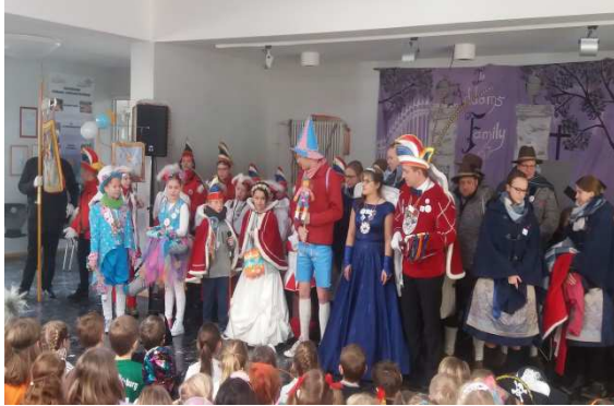
Prinzenpaar und Hofstaat geben sich die Ehre

Natürlich darf in Naumburg auch die Karnevalsfeier nicht fehlen! Am Karnevalsdienstag feierte wieder die gesamte Schule die närrische Zeit mit Puppentheater für die Kleinen, Spiel und Spaß und gemeinsamer Feier in der Aula. Dem Förderverein, der wieder fürs leibliche Wohl sorgte, herzlichen Dank!