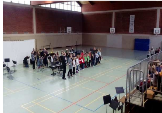
bei der Urkundenverleihung